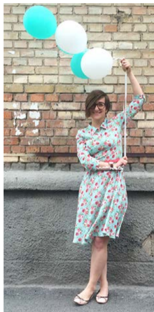
Наконец-то найдены лучшие платья для девочек! Они продаются в фирменных магазинах ANNA VOVK