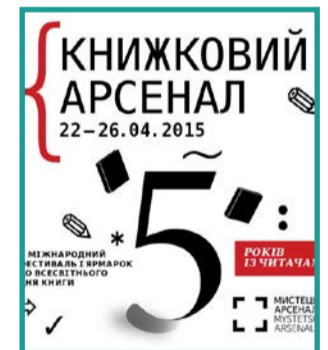
КНИЖКОВИЙ АРСЕНАЛ Киев

Этот фестиваль украинских мастеров настолько разогнался, что уже через пару месяцев ярмарок в Лавре, открыл одноименный магазин в Киеве. Здесь приветствуется все, что сделано украинцами. В магазине большой выбор одежды, кошелечков, чехлов для телефонов и паспортов.