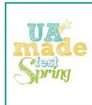
UA MADE Киев