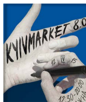
КИЕВ МАРКЕТ Киев

О, этот прекрасный фестиваль проходит всегда под открытым небом. Сюда съезжаются профессионалы со всей страны. На сегодняшний день это самый смелый и прогрессивный маркет. Не всегда здесь палит солнце, но всегда здесь хорошее настроение, одесский юмор и конечно же хорошее настроение!